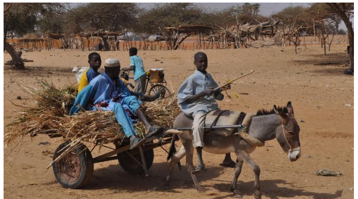
Verkeer langs het moeras van Dori

In Dori zit nu het grootste deel van mijn schoonfamilie. Men heeft daar de rijstcultuur weer opgepakt op de moeras gronden van Dori die in het verleden enkel voor veeteelt werden gebruikt. Dit is een goede ontwikkeling en maakt dat er voorlopig een grote ramp kan worden vermeden.