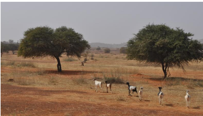
Leven langs de weg van Ouaga naar Dori

Het terrorisme is daarentegen een steeds groter wordend probleem. Zelfs de weg van Ouagadougou naar Dori begint problematisch te worden.