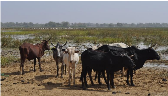
2014 Het moerasgebied bij Dori

Omdat er zoveel talen in de Sahel werden gesproken was de communicatie niet altijd eenvoudig. Gelukkig waren er altijd genoeg vertalers in de buurt zodat het uiteindelijk altijd werd opgelost. Bovendien werkte ik altijd binnen de landbouwdienst waar Frans de werktal was. Ik ben begonnen in Dori een provincie stadje aan de rand van de Sahel. Aan de rand van het meer van Dori introduceerde ik er tuinbouw ontwikkelingen. Na 2 jaar trok ik 200 km. oostelijk naar Djibo.