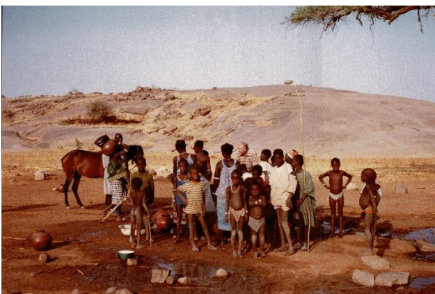
1978 Waterput bij rotsen Aribinda

Nadien ben ik nog een aantal malen verhuisd maar steeds in de Sahel gebleven. Op een gegeven moment werkte ik voor een veeteeltproject nabij de garnizoensplaats Aribinda tussen Dori en Djibo. Sahelp heeft dit project gesteund met neusringen voor de ossen van de Peulen, nomadische veehouders in die regio.