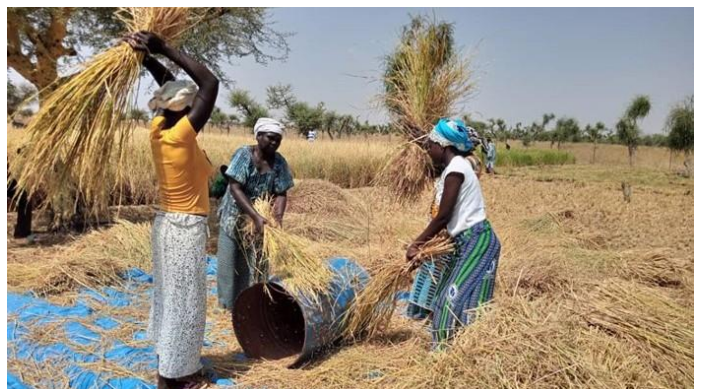
2021 Ontheemden uit Frits woonplaats Liki ontwikkelden de rijstcultuur op de moerasgronden van Dori

Prostaatkanker speelt al twintig jaar een rol in mijn leven en ik heb mij hier in Burkina een paar maanden geleden laten behandelen om verdere ontwikkeling te temperen. Het zijn steeds de testen die laten zien dat er wat aan de hand is want ik heb gelukkig nog steeds geen klachten.